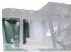
特装展位示例 (不含搭建费)